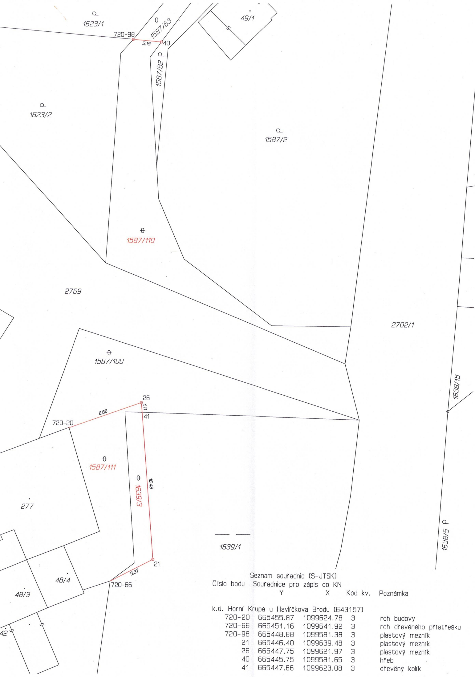
Seznam souřadnic (S-JTSK) Číslo bodu Souřadnice pro zápis do KN Y X Kód kv. Poznámka

k.ú. Horní Krupá u Havlíčkova Brodu (643157)